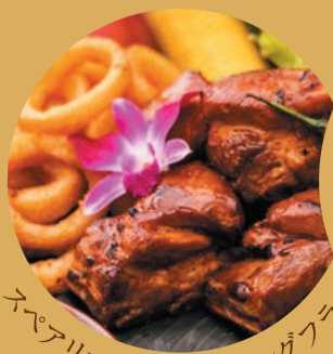
スパアリブとオニオンリングフラット