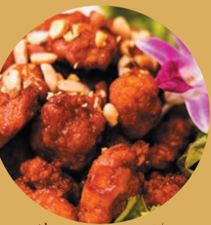
ヤンニョムチキン

※掲載写真はランチ&ディナーのイメージです。 ランチとディナーではメニューが異なります。