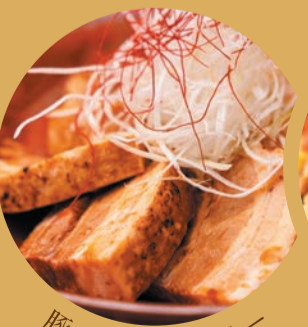
豚バラ肉のラフテー