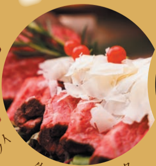
牛肉のタリアータ