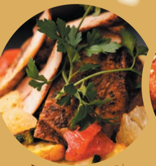
スパイシーチキン