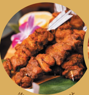
串焼き盛り合わせ