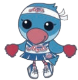
木下アビエル神奈川 マスコットキャラクター 「えるる」