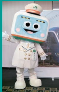
JR東日本 横浜支社 マスコットキャラクター 「ハマの電ちゃん」