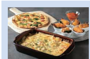
※写真はランチ&ディナーbuffetのイメージです。