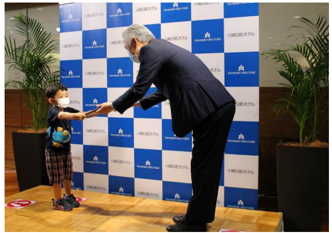
〈6月21日表彰式の模様〉