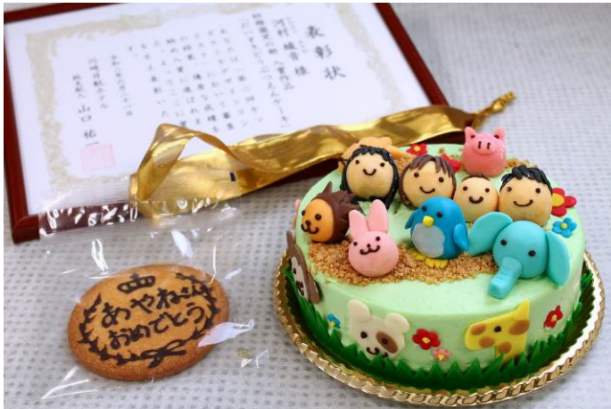
〈表彰状&再現したケーキ&お菓子のメダル〉

本プログラムを通し、多くのお子様にご参加いただけたこと、そして多くのお子様の笑顔に触れられたことに大変感動をいたしました。これからも川崎日航ホテルは、地域の皆様との交流を目的に小さなお子様から大人の方まで楽しんでいただけるようなイベント企画を実施してまいります。