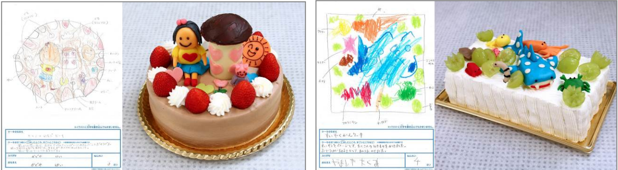
※幼稚園児の部 入賞作品一例