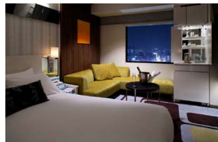
エグゼクティブダブルルーム

ホームページ http://www.kawasaki-nikko-hotel.com